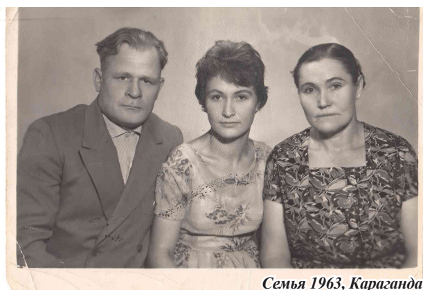
Семья 1963, Караганда