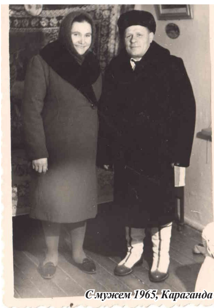
С мужем 1965, Караганда

В 1952 году я пошла уже на производство, ну тут уж что-то зарабатывала. Тинейджер (апрель-июнь №23)